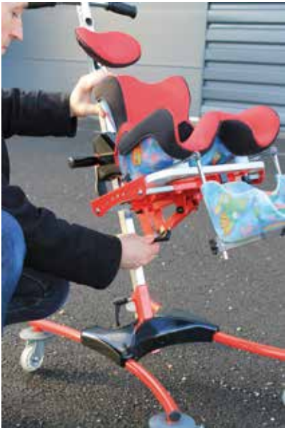
Levier (5) de réglage d'angle