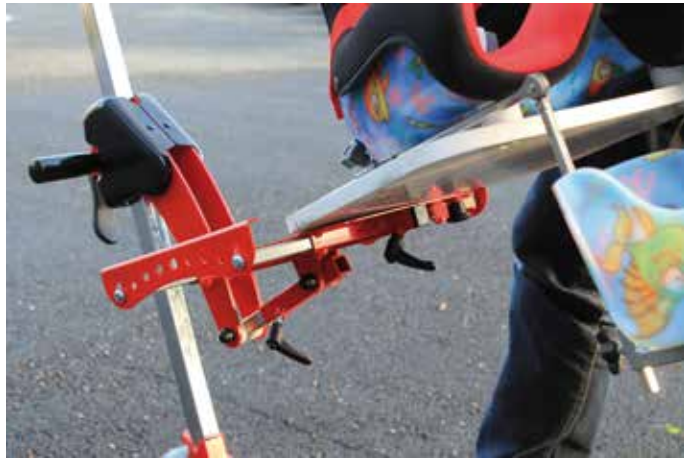
Réglage des rails latéraux