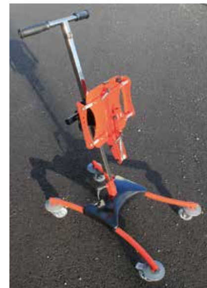
Assise entièrement pliée