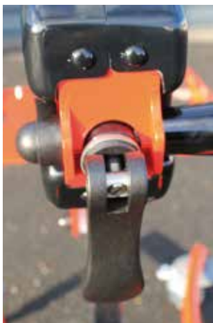
Levier à came (1)